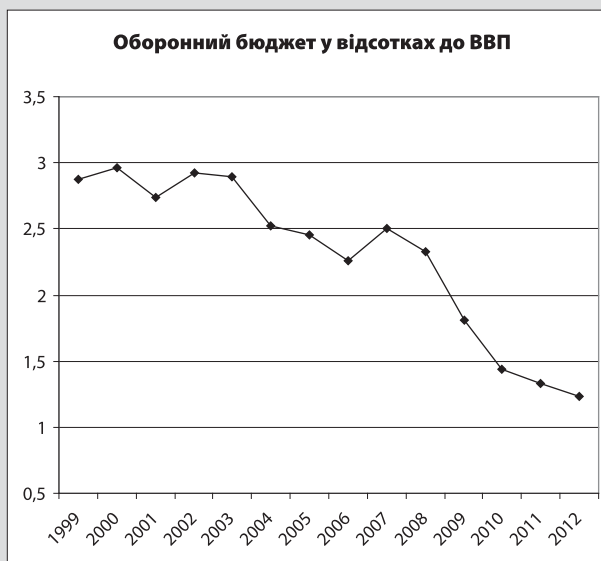
Мал. 1.2: Оборонний бюджет Болгарії у відсотках до ВВП